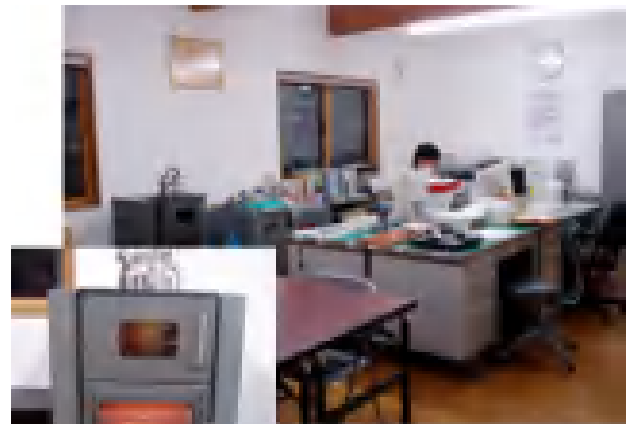
事務所内のように

10月8日に行われたオープニングセレモニーでは星山神楽権現舞、通称「柱かじりの舞」が催されました。(写真左)