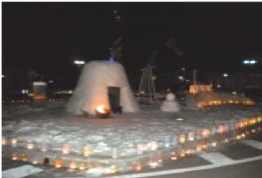
2012年1月の冬まつりの様子