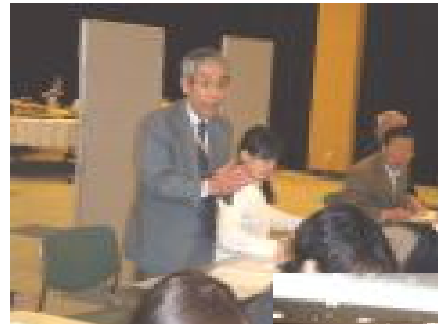
楽しかった 懇親会