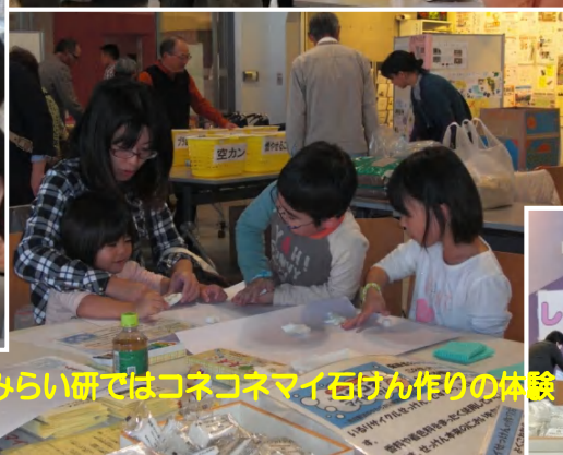
みらい研ではコネコネマイ石けん作りの体験