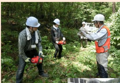
チェーンソーの構え方や、メンテナンスの仕方など森林整備の基本を教わります