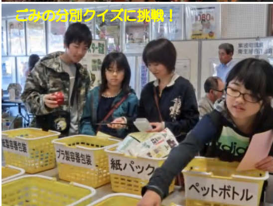
ごみの分別クイズに挑戦!