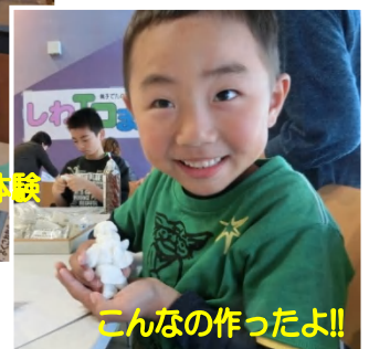
こんなの作ったよ!!

会場の市民交流ステージにはたくさんの方が訪れました。 ごみの分別やリサイクル工作、木に触れたりお話を聞いたりいろいろな体験をとおして、たのしく環境に興味をもってもらえたようです。